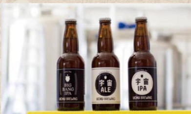
うちゅうブルーイング(ビール)