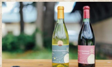
シャルマンワイン(ワイン)