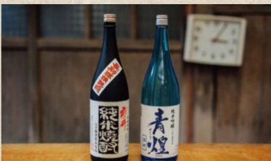
武の井・青煙(焼酎/日本酒)