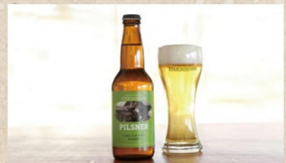
八ヶ岳ビールタッチダウン(ビール)